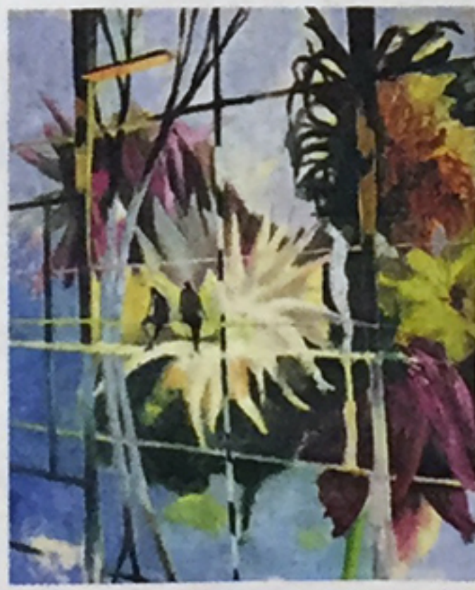
”Växthus” av Bo Ljung.

verka samtidigt och det ger tusen olika möjligheter. Allt blir som en smältdegel.