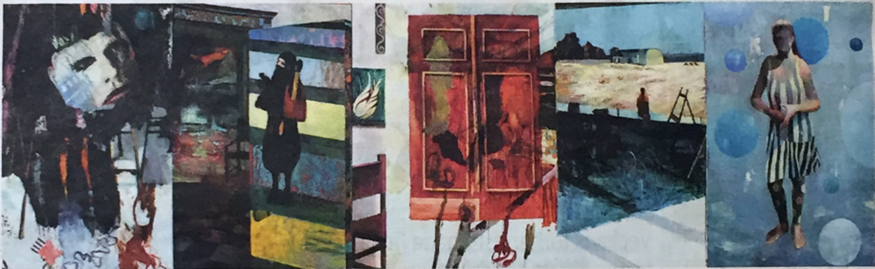
”Samtidigheter”, målning av Bo Ljung.